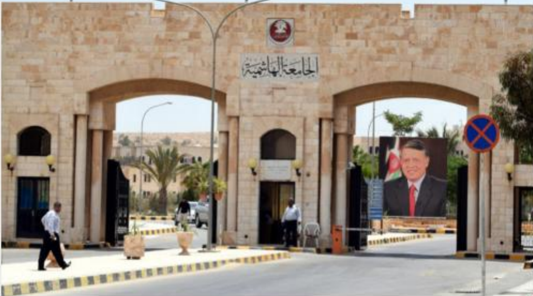
مبنى الجامعة الهاشمية

تاريخ الإنشاء 2026-06-01 14:52:57 آخر تحديث 2026-06-01 23:29:50